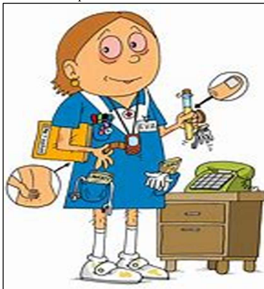
Obrázek 1 Popisek obrázku